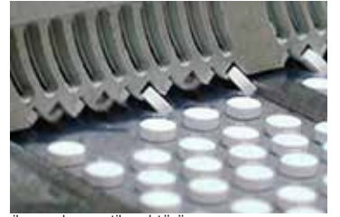
ila ve kozmetik sektörü